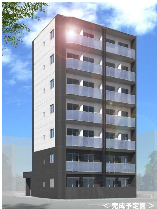
< 完成予定図 >